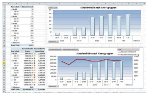
Microsoft Excel als vollwertiges BI-Werkzeug